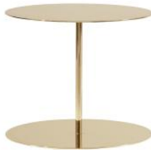
ottone / brass

Il tavolino Gong Lux è composto da due lastre di metallo tagliate a laser connesse da uno stelo centrale in tubolare di ferro. Lo spessore di questo tavolino è stato ridotto al minimo, senza tuttavia comprometterne la resistenza. Gong Lux è smontabile ed è disponibile in due dimensioni, con finitura lucida a bagno galvanico.