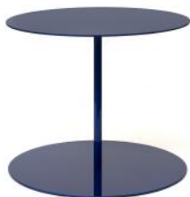
blu metallico / metallic blue