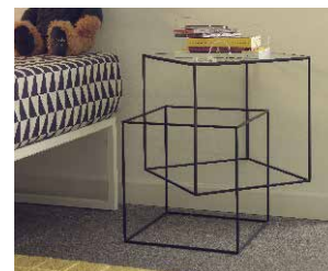
THIN BLACK TABLE

Lucky | Peg Bed | Peg Chair | Koeda | Tuta | Waku