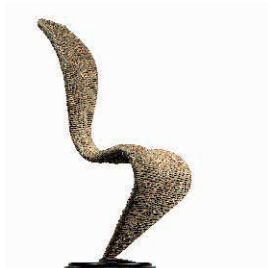
paglia di palude - marsh straw