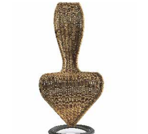
midollino - wicker