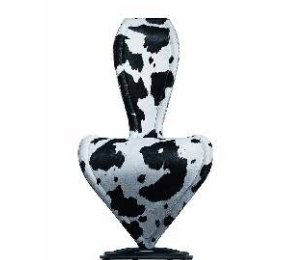
pelle - leather