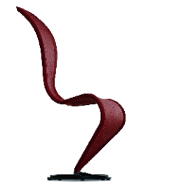
tessuto - fabric