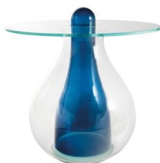
blu avio / avio blue

MYA1 tavolino alto, Ø60 cm MYA2 tavolino basso, Ø90 cm