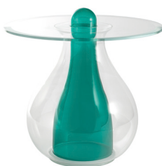
verde smeraldo / emerald green

Service tables available in two colors, composed by blown glass parts and extralight glass plate parts.