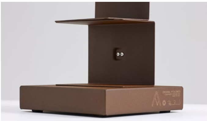
Base incisa con la firma del designer e il premio Compasso d'Oro. The base is engraved with the designer's signature and the Compasso d'Oro award.