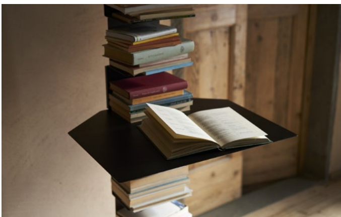
Ptolomeo® Shelf, mensola/ripiano in acciaio Ptolomeo® Shelf, steel shelf